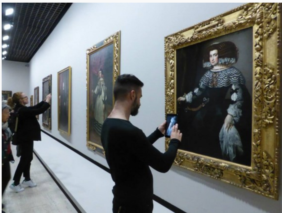
Des visiteurs photographes dans l'exposition Velasquez du Grand Palais (avril 2015)